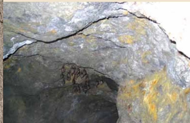
Významné zimovisko netopierov na Slovensku

Hlavné drahoopálové ložisko predstavuje Li-banka. Pozostáva z viacerých menších banských polí. Vzniklo tu unikátne bludisko podzemných chodieb dlhých približne 20 km. Sú rozložené do 15 poschodí, z ktorých sú niektoré zatopené, v iných vznikla ľadová výzdoba. Aj keď sa banské diela stali útočiskom mnohých drobných živočíchov a dokonca aj väčších cicavcov, dominantné postavenie majú netopiere, ktoré obsadzujú prakticky celé podzemie. Odhaduje sa, že v areáli zimuje tisíc až tritisíc netopierov, medzi ktorými bolo identifikovaných šesťnásť druhov. Pre netopiera brvitého Dubnícke bane predstavujú najvýznamnejšie známe zimovisko na Slovensku. Najpočetnejším druhom v chránenom území je podkóvár malý.